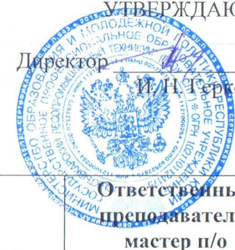
График производственных практик на 2016-2017 учебный год